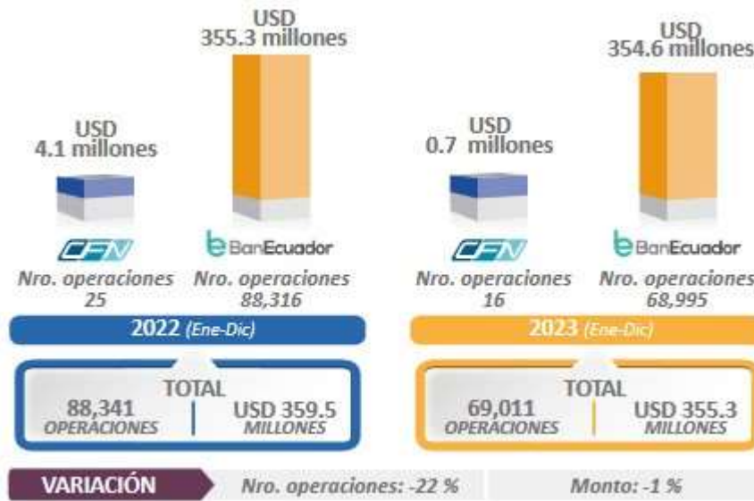
Gráfico Nro. 13: Crédito Público Agropecuario (Crédito acumulado por instituciones)