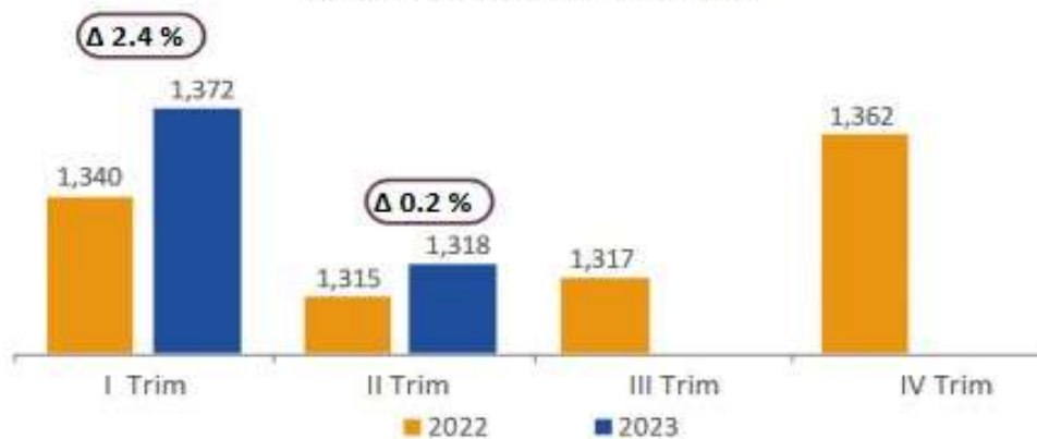
Gráfico Nro.7: Valor Agregado Bruto Agropecuario (precios constantes, millones USD 2007)

Como se puede visualizar en el gráfico, durante el segundo trimestre del año 2023, el sector agropecuario registró un Valor Agregado Bruto (VAB) 0,2% en comparación al valor registrado en el año 2022, al momento no se encuentra registrado el dato del tercer o cuarto trimestre del año 2023.